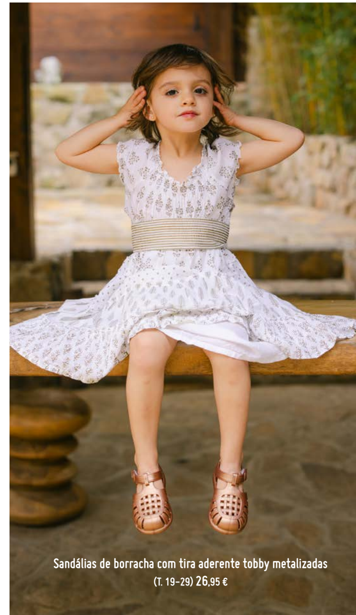
Sandálias de borracha com tira aderente toby metalizadas (T. 19-29) 26,95 €