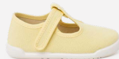
Pepitos barefoot de lona canvas com tira aderente (T. 20-26) 36,95 €