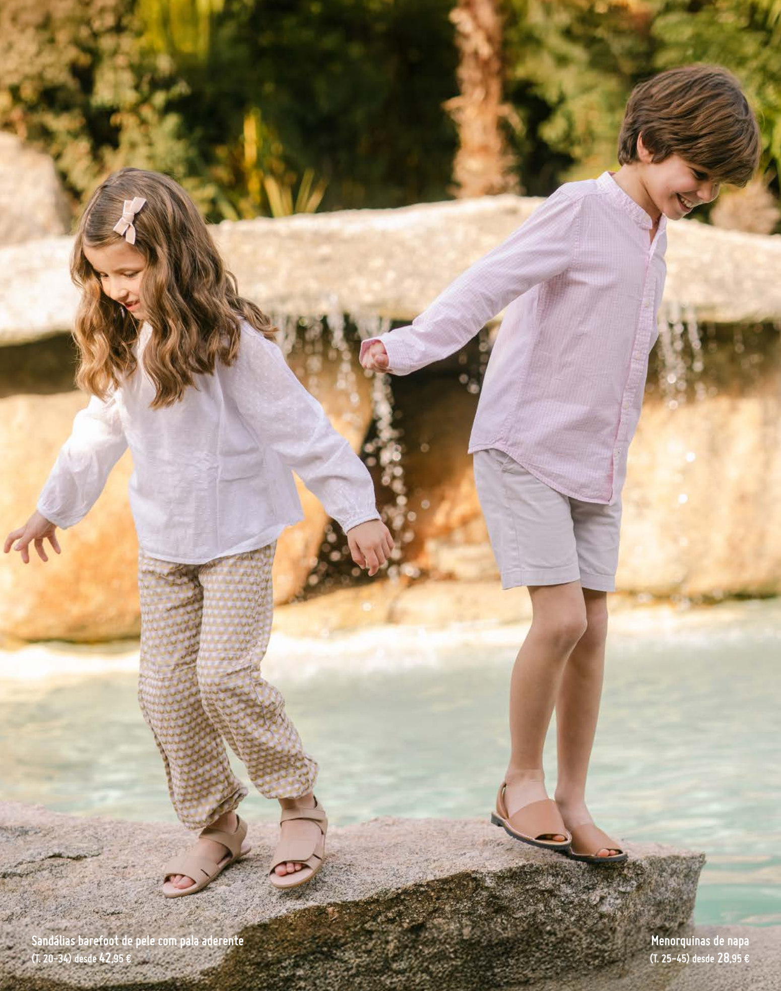
Sandálias barefoot de pele com pala aderente (T. 20-34) desde 42,95 €