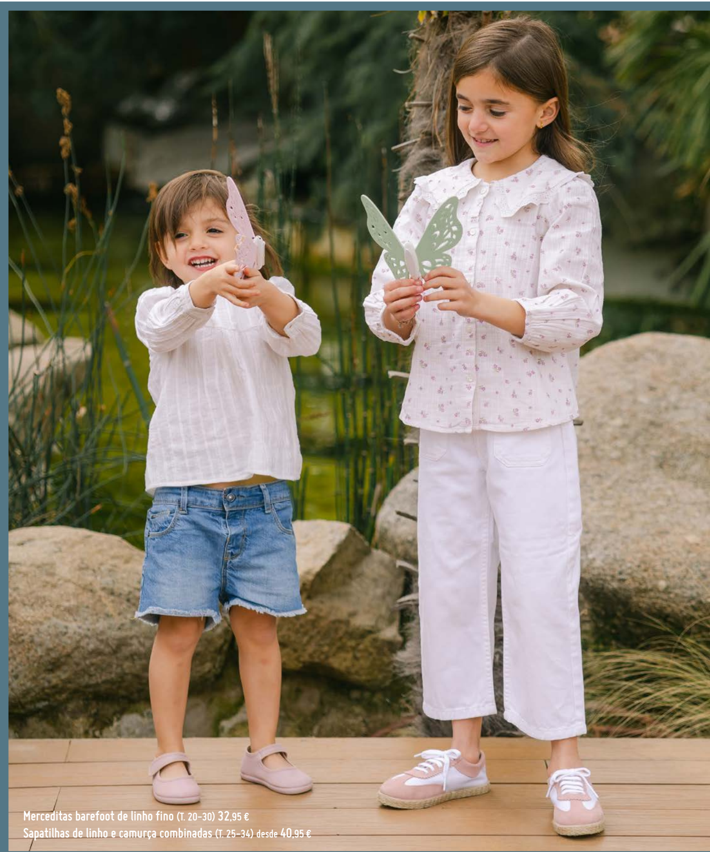
Merceditas barefoot de linho fino (T. 20-30) 32,95 € Sapatilhas de linho e camurça combinadas (T. 25-34) desde 40,95 €