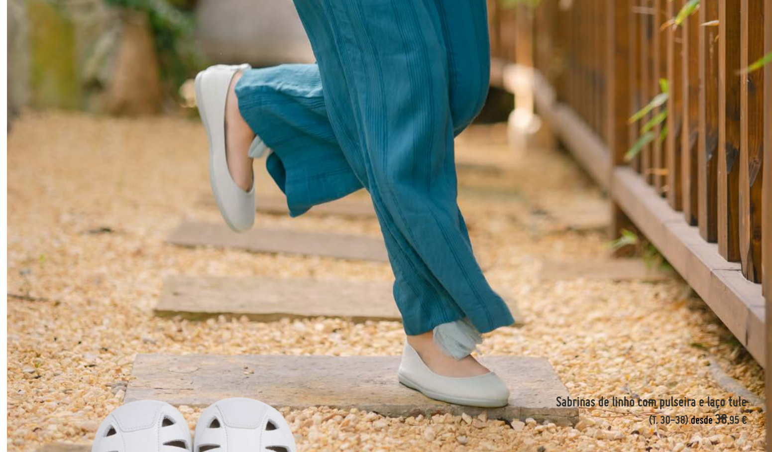
Sabrinhas de linho com pulseira e laço tule (T. 30-38) desde 38,95 €