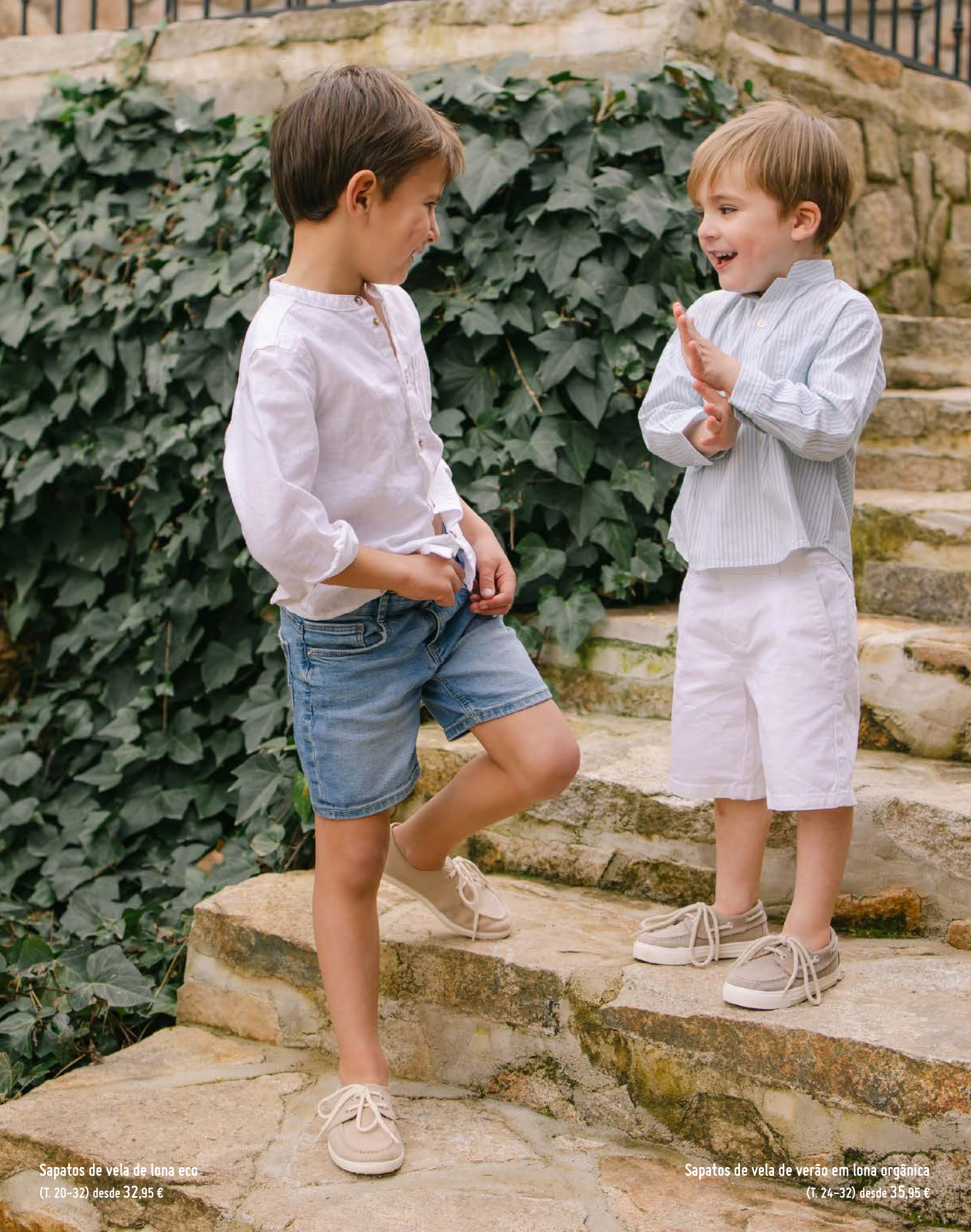
Sapatos de vela de lona eco (T. 20-32) desde 32,95 €