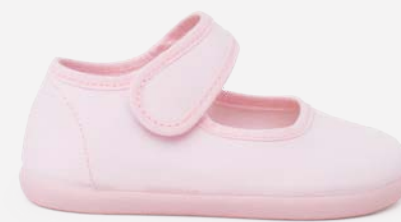
Merceditas barefoot de lona com fecho largo (T. 20-30) 30,95 €