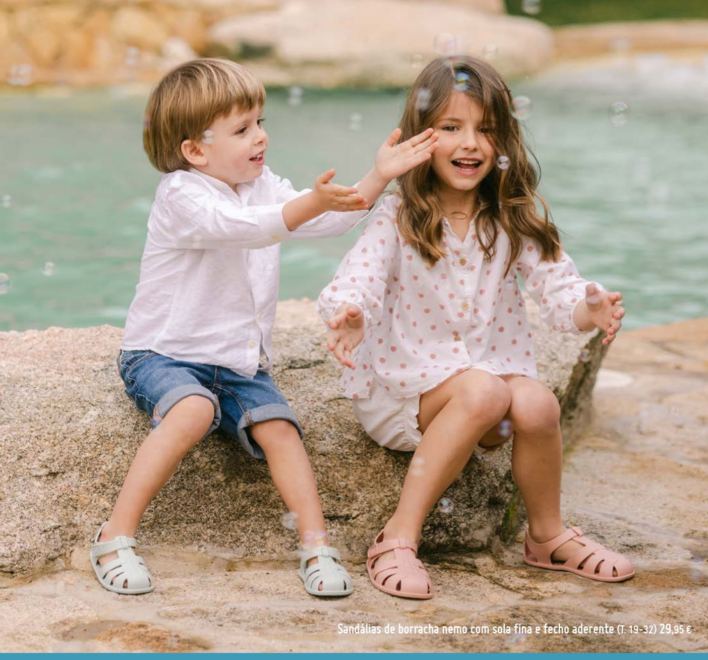
Sandálias de borracha nemo com sola fina e fecho aderente (T. 19-32) 29,95 €