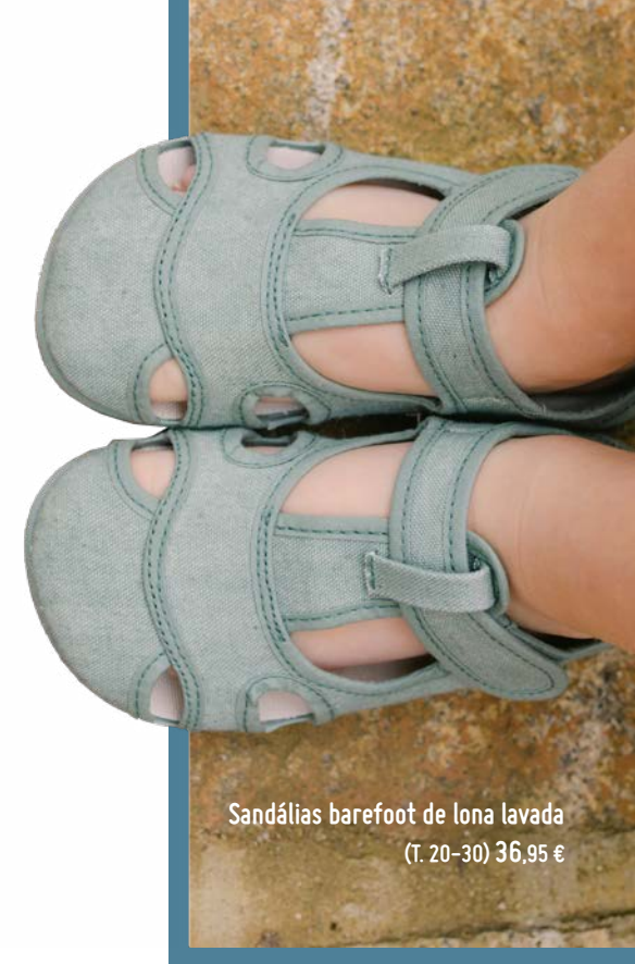
Sandálias barefoot de lona lavada (T. 20-30) 36,95 €