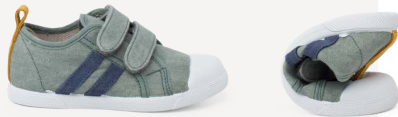
Sapatilhas flexíveis de lona eco combinadas (T. 22-32) desde 38,95 €