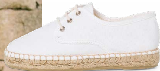
Blucher de lona com sola alpercata (T. 24-41) desde 36,95 €