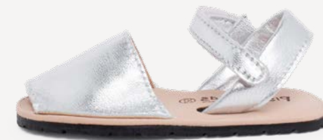
Menorquinas metalizadas maleáveis com sola flexível (T. 21-32) desde 38,95 €