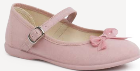
Merceditas com laço brilho nacarado (T. 24-34) desde 36,95 €