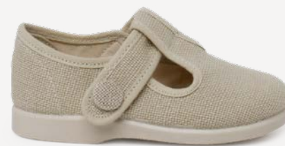
Pepitos de linho com fecho aderente botão (T. 19-26) 26,95 €