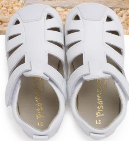
Sandálias maleáveis de napa com sola fina (T. 19-26) 50,95 €