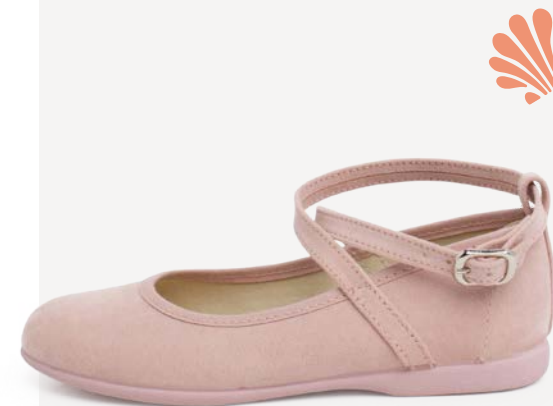
Merceditas tipo camurça com tira cruzada e fivela (T. 28-38) desde 34,95 €