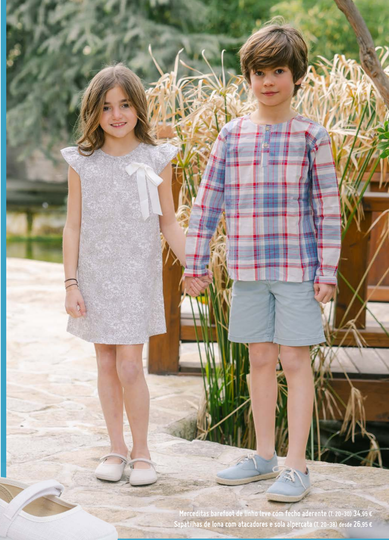
Merceditas barefoot de linho leve com fecho aderente (T. 20-30) 34,95 € Sapatilhas de lona com atacadores e sola alpercata (T. 20-38) desde 26,95 €