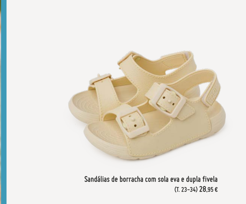
Sandálias de borracha com sola eva e dupla fivela (T. 23-34) 28,95 €