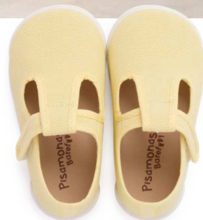
Pepitos barefoot de lona canvas com tira aderente (T. 20-26) desde 36,95 €