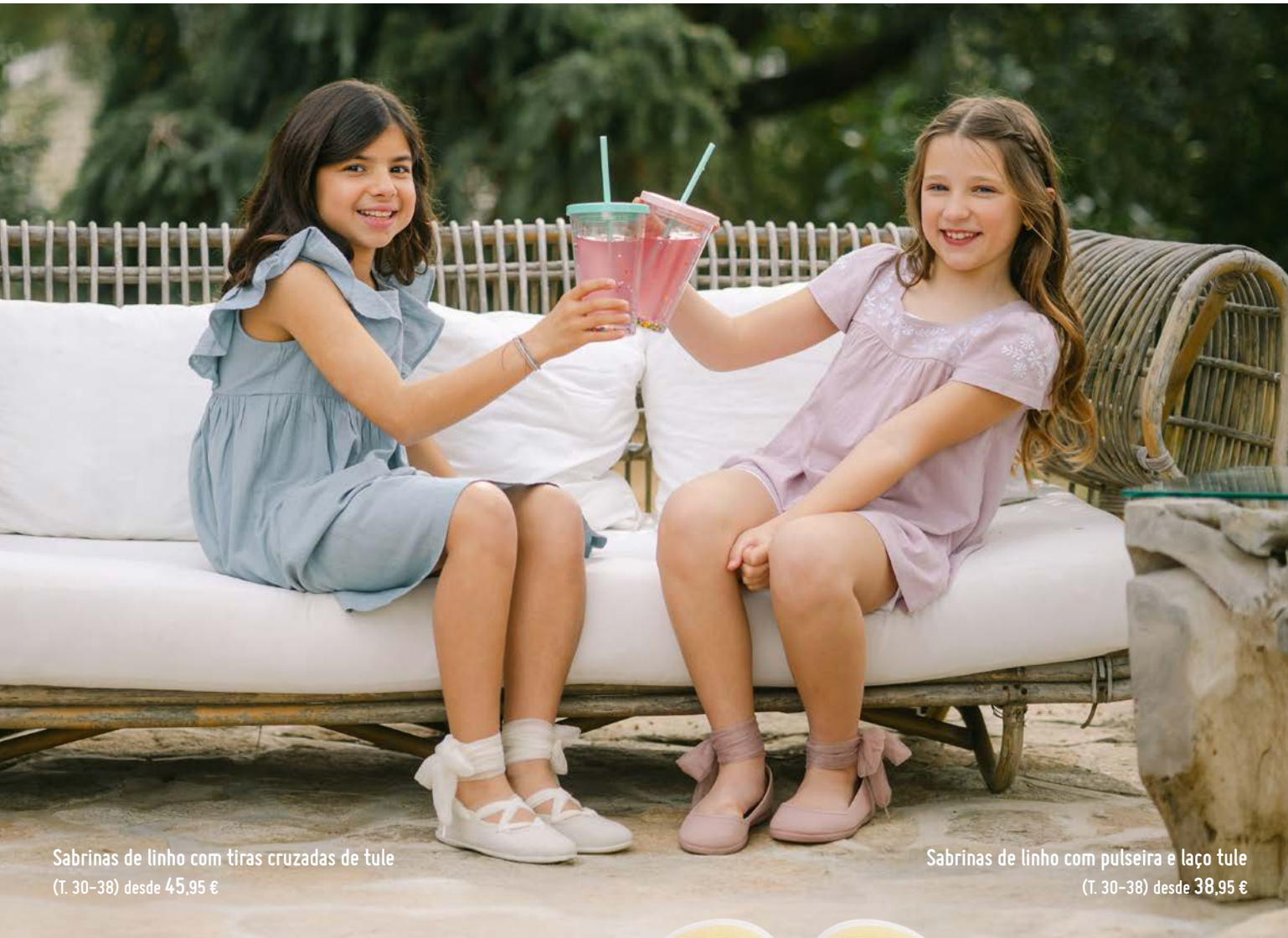
Sabrinhas de linho com tiras cruzadas de tule (T. 30-38) desde 45,95 €