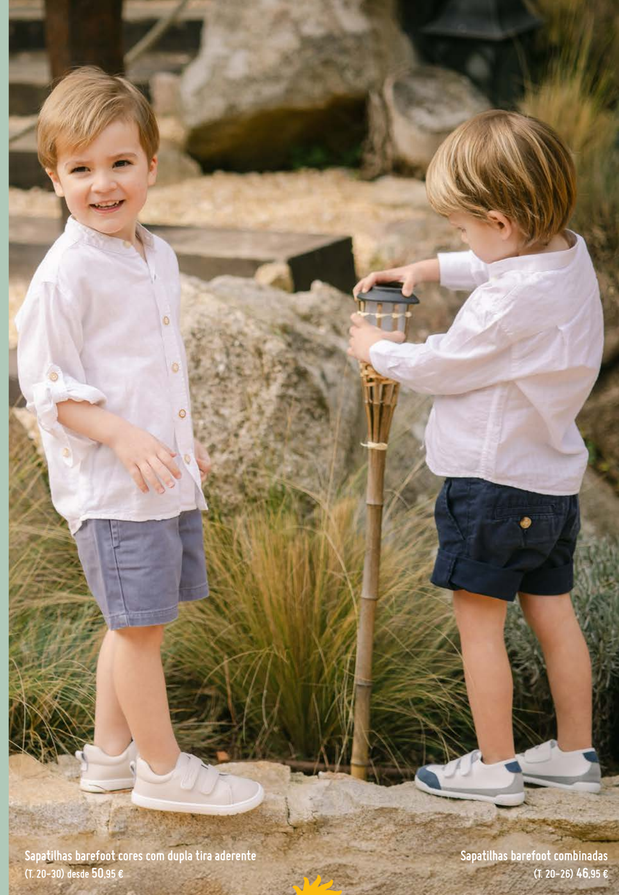
Sapatilhas barefoot cores com dupla tira aderente (T. 20-30) desde 50,95 €