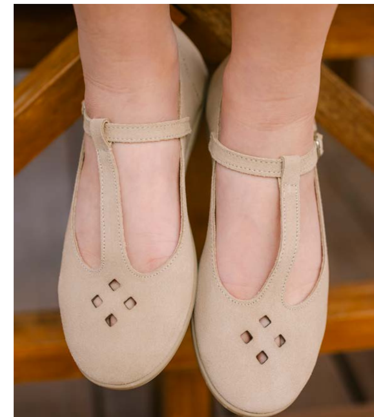
Merceditas de camurça perfurada com tira peito do pé (T. 28-39) desde 42,95 €