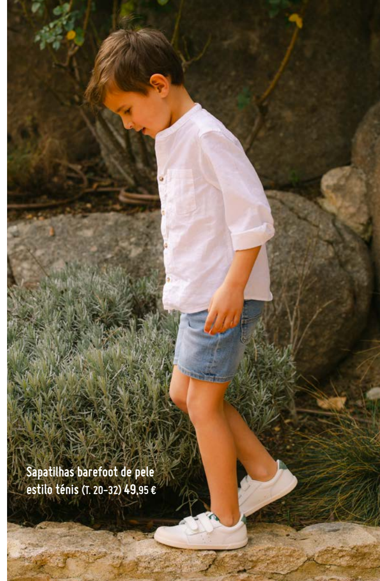
Sapatilhas barefoot de pele estilo ténis (T. 20-32) 49,95 €