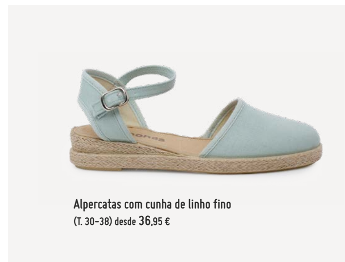
Alpercatas com cunha de linho fino (T. 30-38) desde 36,95 €