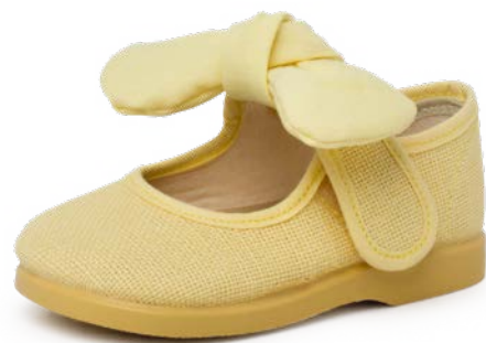
Merceditas de linho com laço e fecho aderente (T. 18-26) 26,95 €

Nas próximas páginas, encontrará artesanato, muito estilo e as últimas tendências. Tons metalizados, cores suaves e materiais leves e respiráveis. Linhas minimalistas e elegantes convivem com novos modelos barefoot, que se adaptam a cada pezinho com o máximo cuidado em todos os detalhes. Sandálias, alpercatas, sandálias de borracha prontas para o sol completam uma coleção pensada para aproveitar tudo sem limites. Que comece a estação mais bonita do ano!