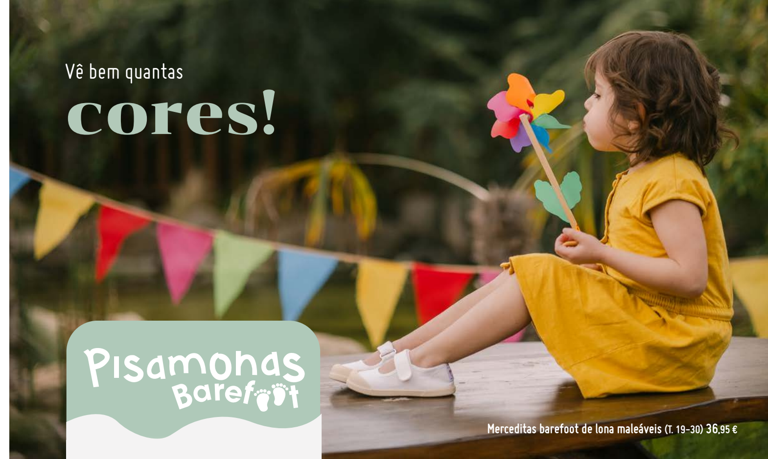
Merceditas barefoot de lona maleáveis (T. 19-30) 36,95 €