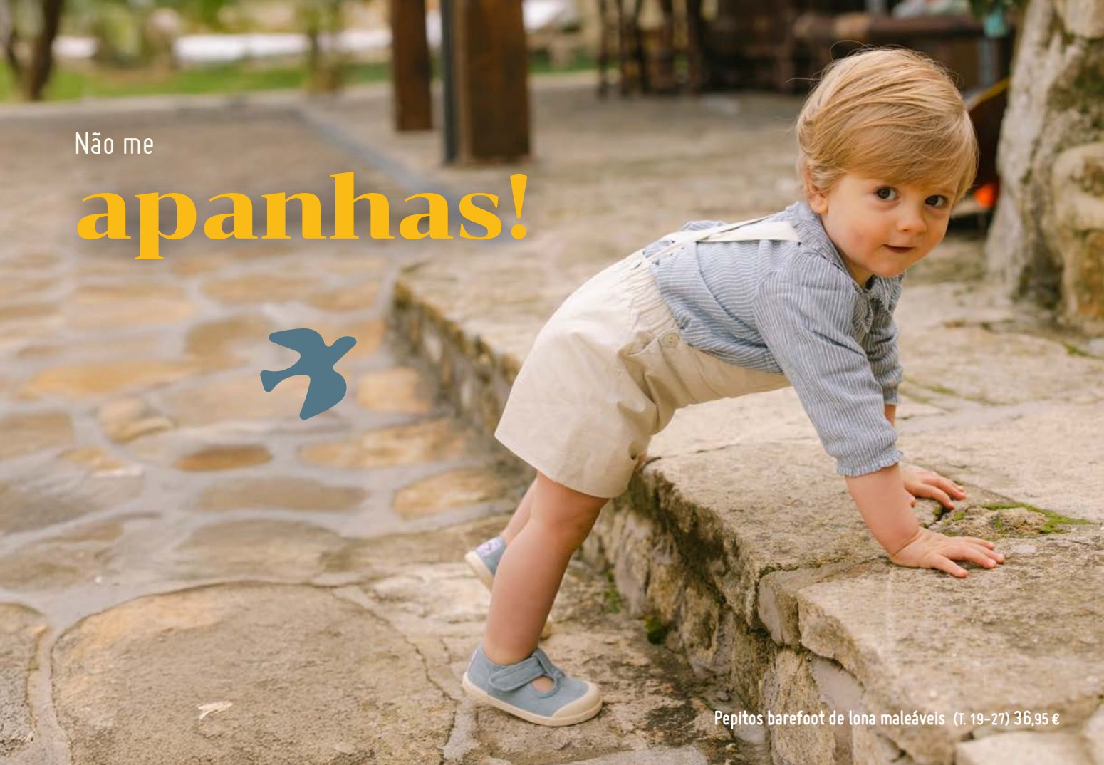
Pepitos barefoot de lona maleáveis (T. 19-27) 36,95 €