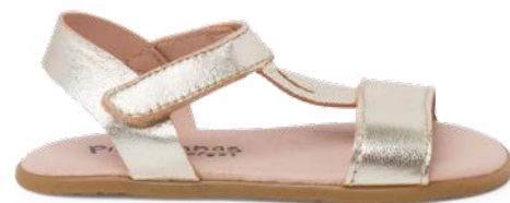
Sandálias barefoot com tiras peito do pé metalizadas (T. 20-34) desde 44,95 €