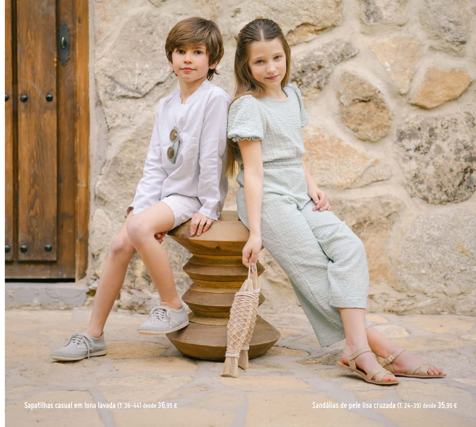
Sapatilhas casual em lona lavada (T. 36-44) desde 36,95 €