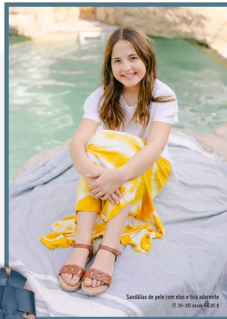
Sandálias de pele com elos e tira aderente (T. 30-39) desde 46,95 €