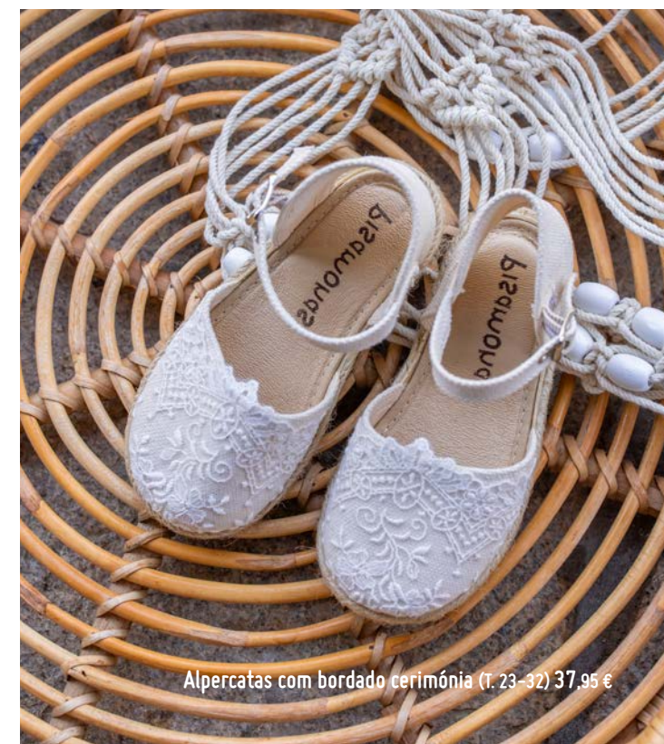
Alpercatas com bordado cerimónia (T. 23-32) 37,95 €