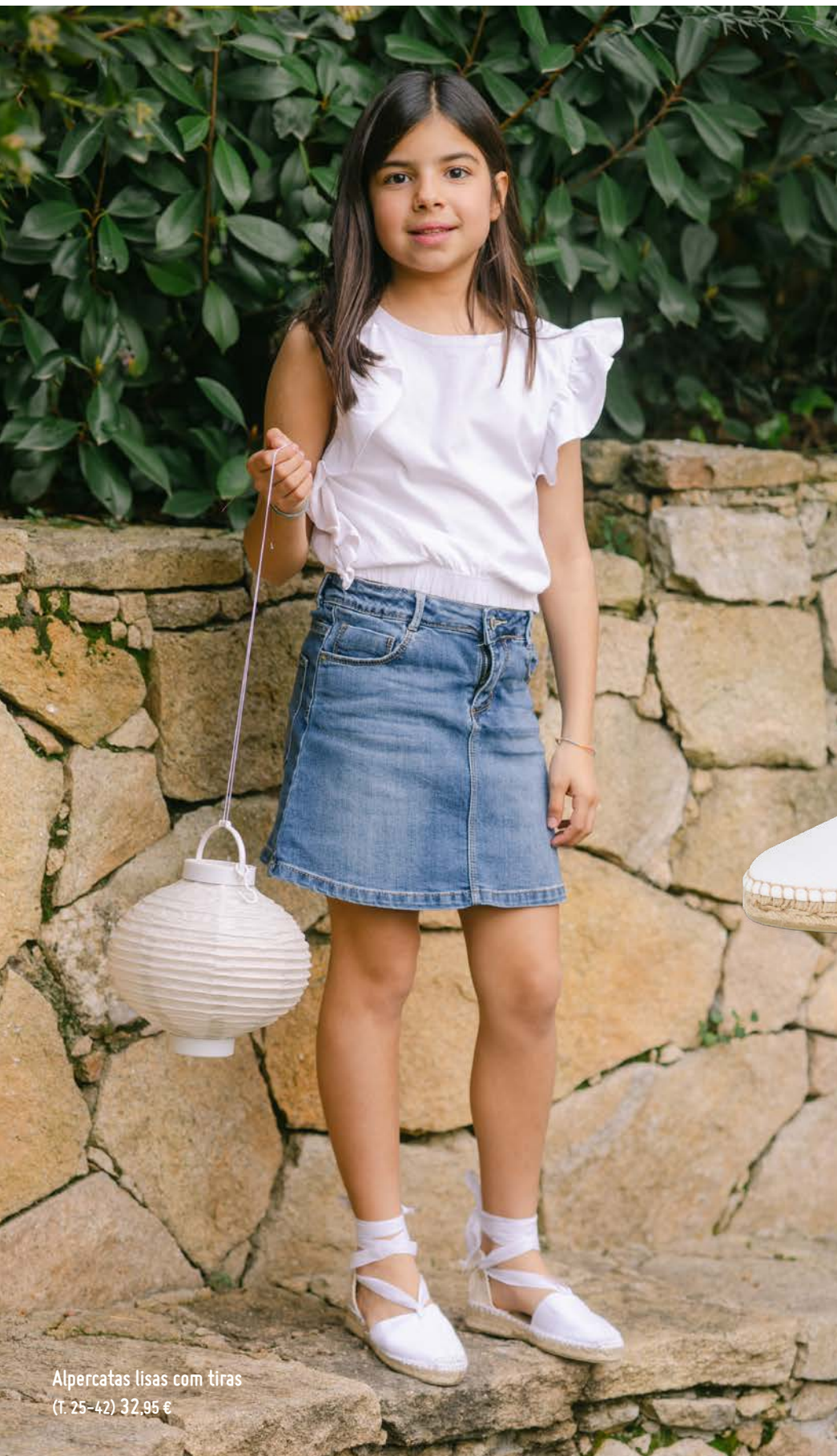
Alpercatas lisas com tiras (T. 25-42) 32,95 €