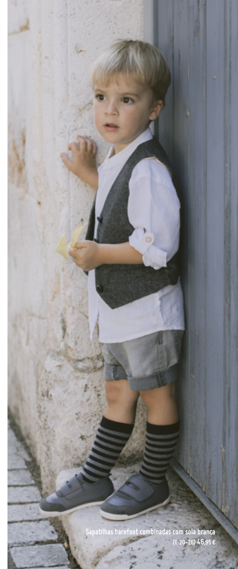
Sapatilhas barefoot combinadas com sola branca (T. 20-26) 46,95 €