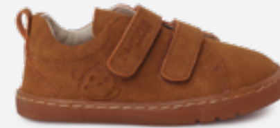
Sapatilhas barefoot tipo pele gravada (T. 20-30) desde 48,95 €