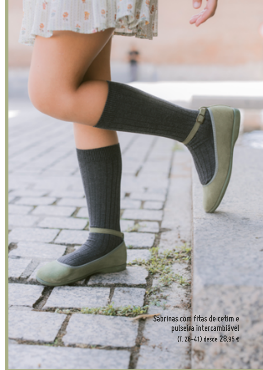
Sabrinhas com fitas de cetim e pulseira intercambiável (T. 26-41) desde 28,95 €

As cores? As de máxima tendência. Os materiais? Quentes e resistentes. O protagonista? O conforto. Descubra todas as novidades da temporada, desenhadas para que os pés dos seus filhos cresçam felizes e com opções para toda a família! Não perca as próximas páginas.