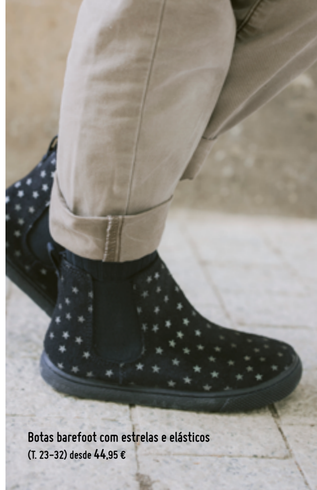
Botas barefoot com estrelas e elásticos (T. 23-32) desde 44,95 €