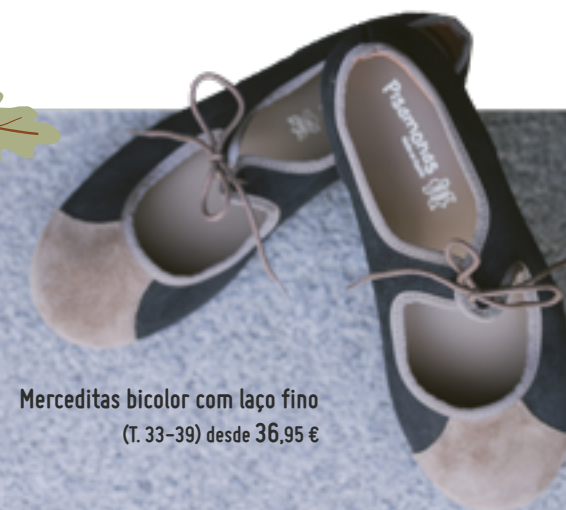
Merceditas bicolor com laço fino (T. 33-39) desde 36,95 €