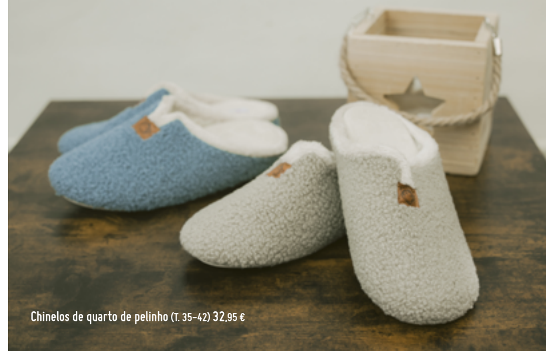
Chinelos de quarto de pelinho (T. 35-42) 32,95 €