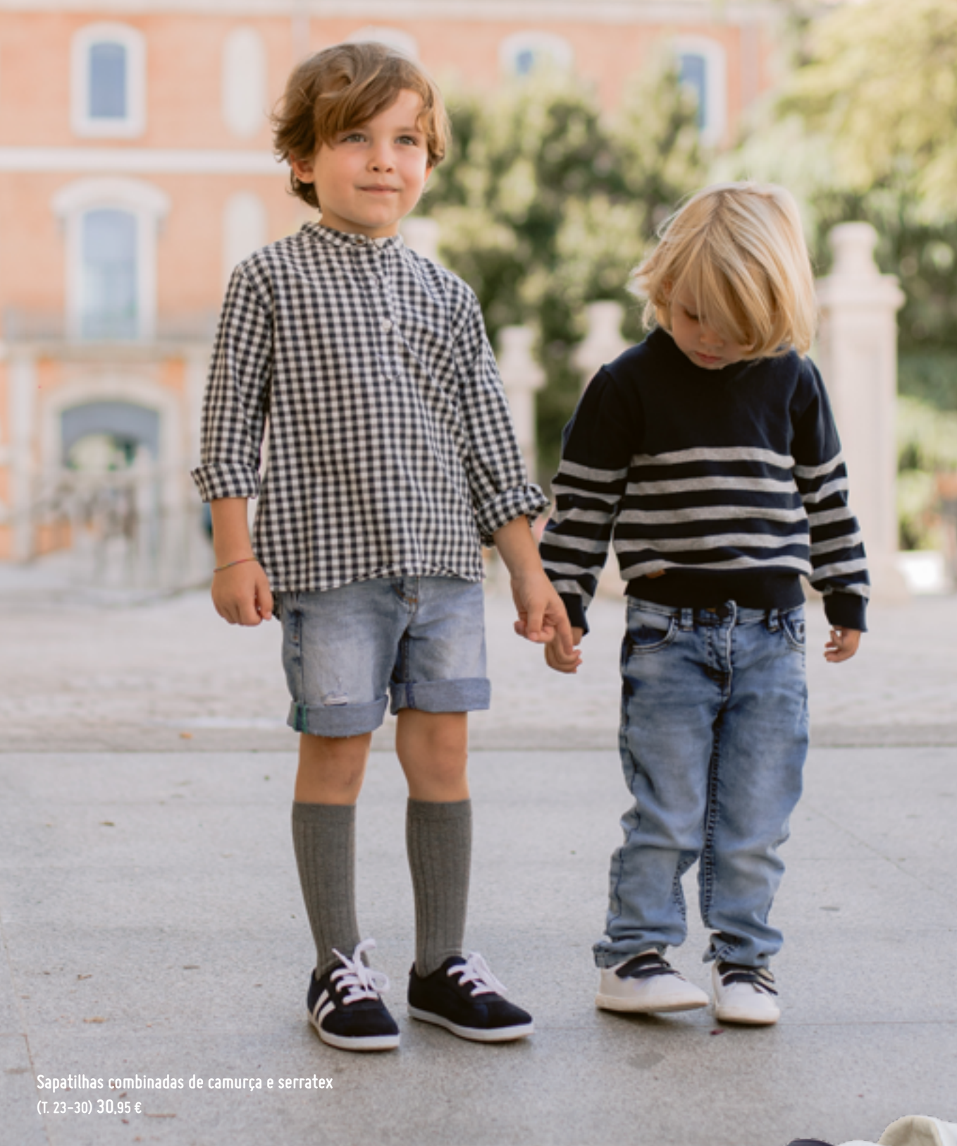
Sapatilhas combinadas de camurça e serratex (T. 23-30) 30,95 €