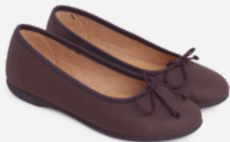
Sabrinas flexíveis de pele vegana (T. 32-41) 29,95 €