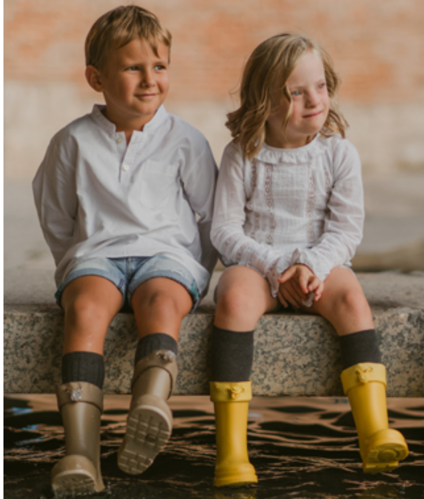
Galochas flexíveis e ajustáveis (T. 20-32) 34,95 € Galochas com cano ajustável (T. 20-30) 29,95 €