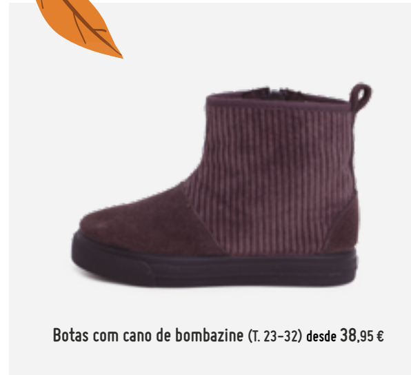
Botas com cano de bombazine (T. 23-32) desde 38,95 €