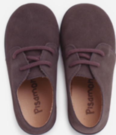
Bluchers de camurça com atacadores e sola fina (T. 20-30) 30,95 €