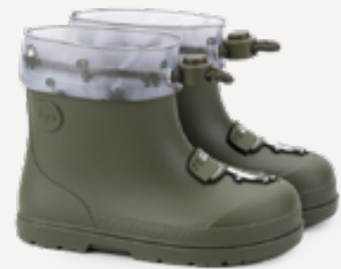
Botins galocha ajustáveis barefoot com dinossauro (T. 20-28) 35,95 €