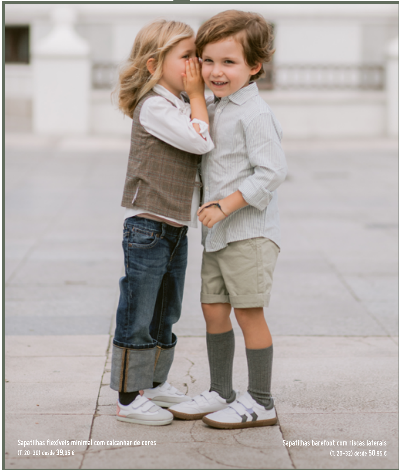
Sapatilhas flexíveis minimal com calcanhar de cores (T. 20-30) desde 39,95 €