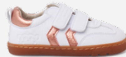
Sapatilhas barefoot com riscas laterais metalizadas (T. 20-32) desde 50,95 €