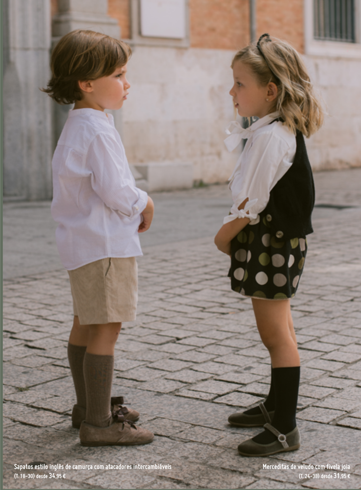
Sapatos estilo inglês de camurça com atacadores intercambiáveis (T. 18-30) desde 34,95 €