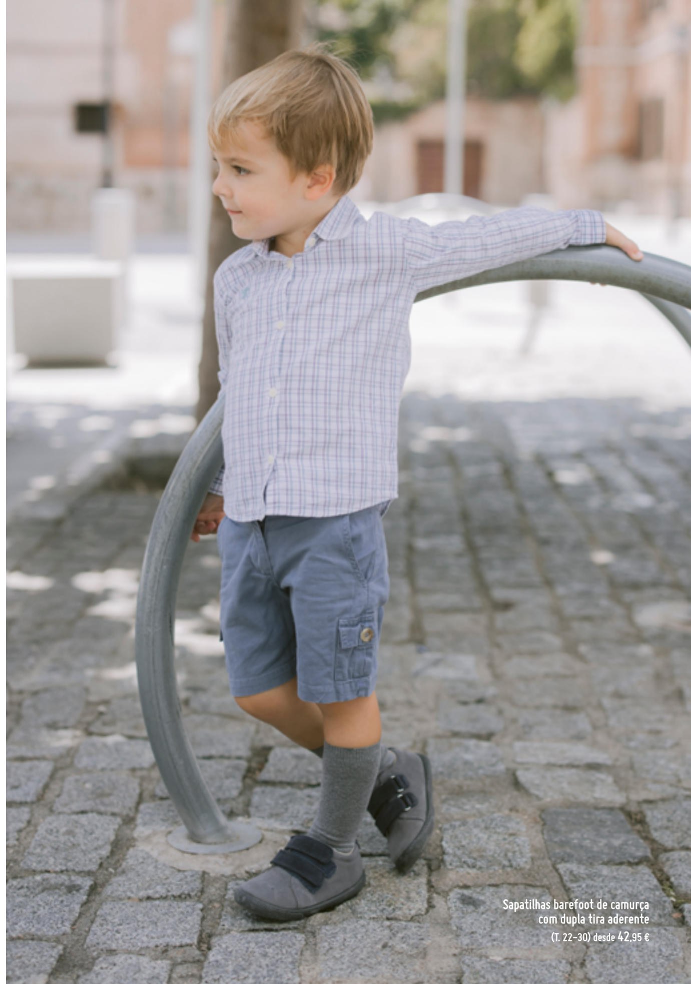
Sapatilhas barefoot de camurça com dupla tira aderente (T. 22-30) desde 42,95 €