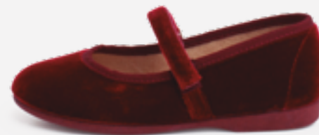
Merceditas de veludo com tira fina aderente (T. 22-34) desde 24,95 €