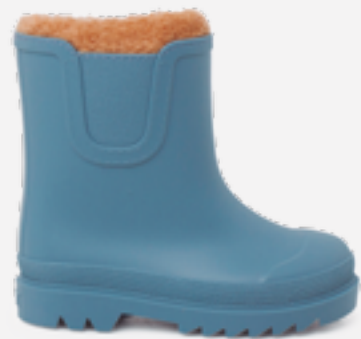
Galochas com pelinho (T. 22-32) 34,95 € (precio PT)