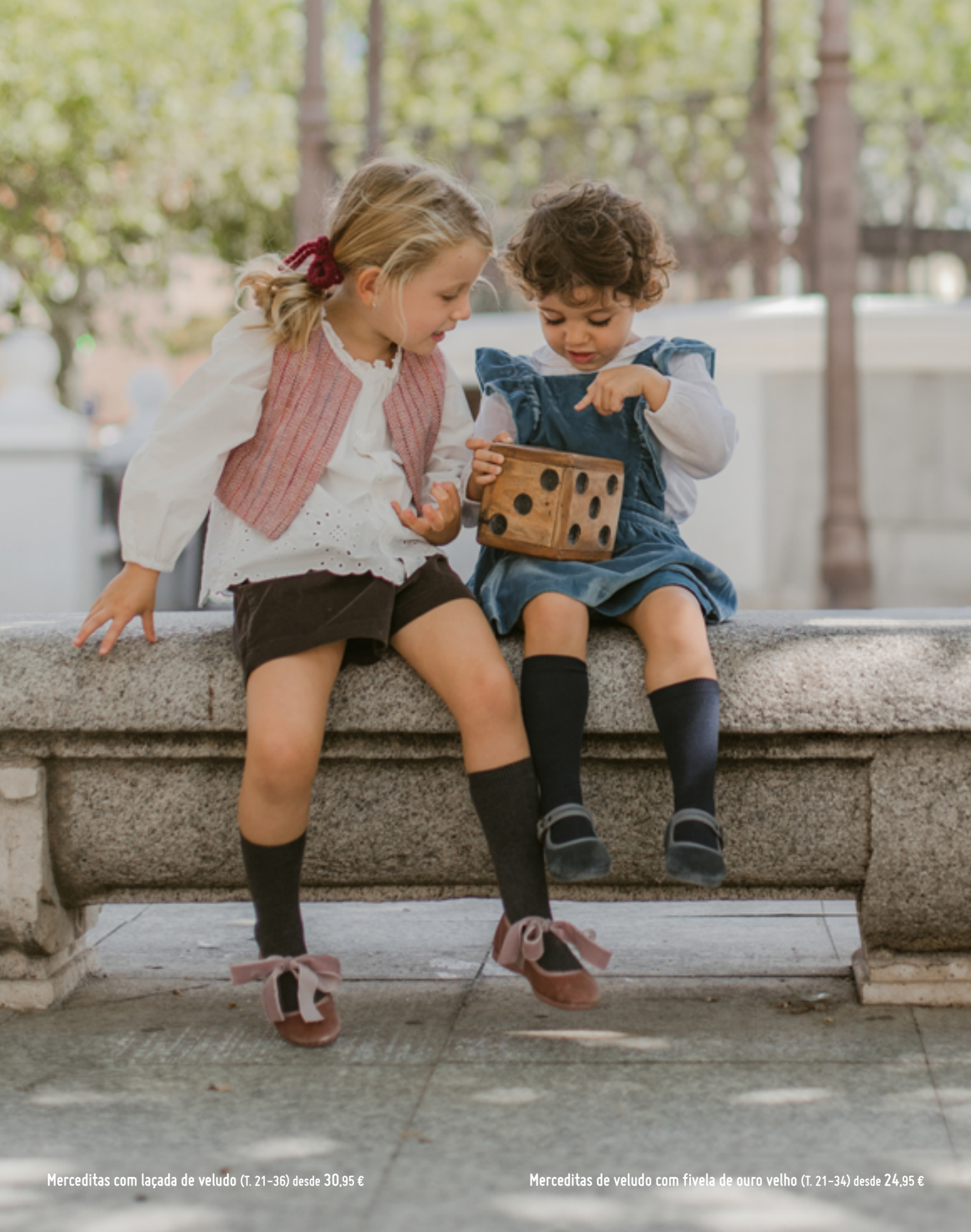
Merceditas com laçada de veludo (T. 21-36) desde 30,95 €