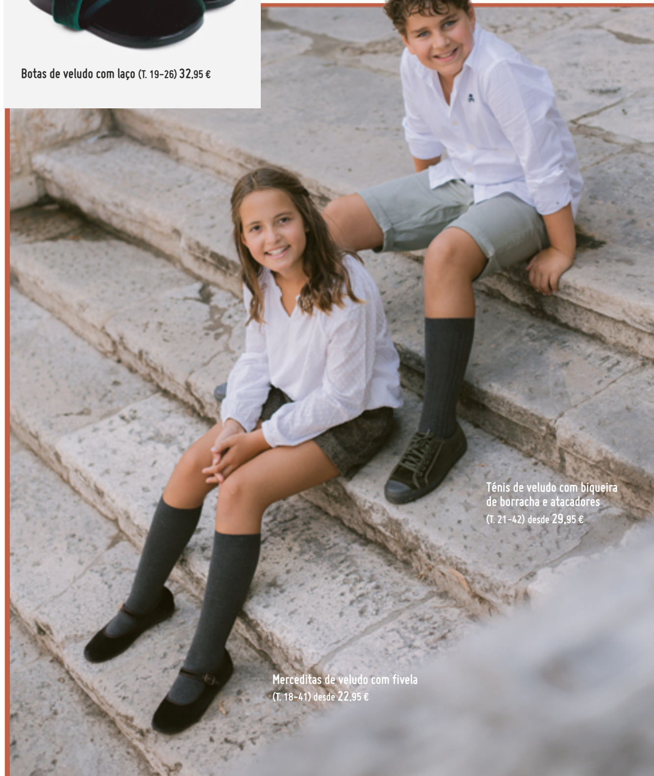
Tênis de veludo com biqueira de borracha e atacadores (T. 21-42) desde 29,95 €