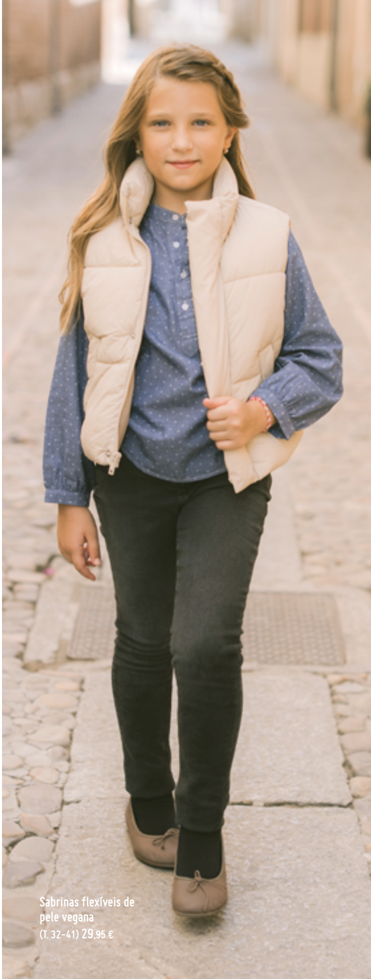
Sabrinas flexíveis de pele vegana (T. 32-41) 29,95 €