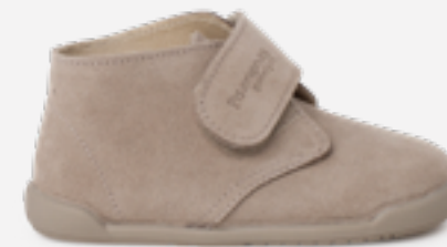
Botas barefoot de camurça com fecho aderente (T. 19-26) 42,95 €