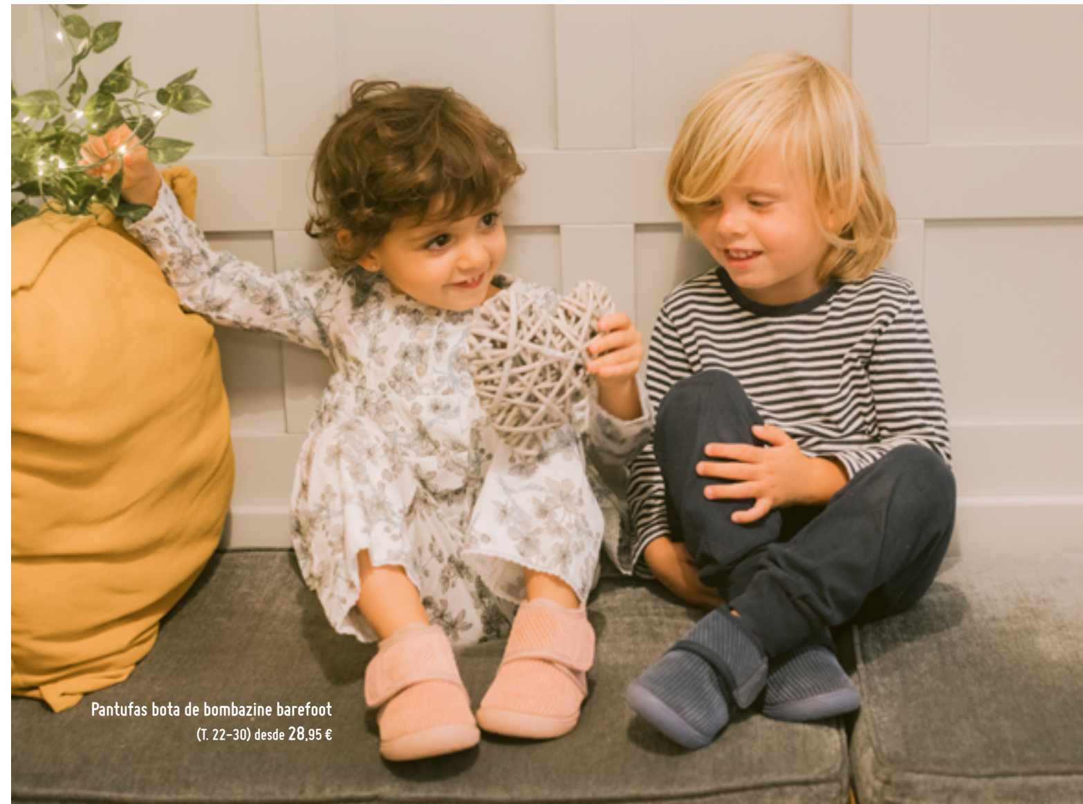
Pantufas bota de bombazine barefoot (T. 22-30) desde 28,95 €