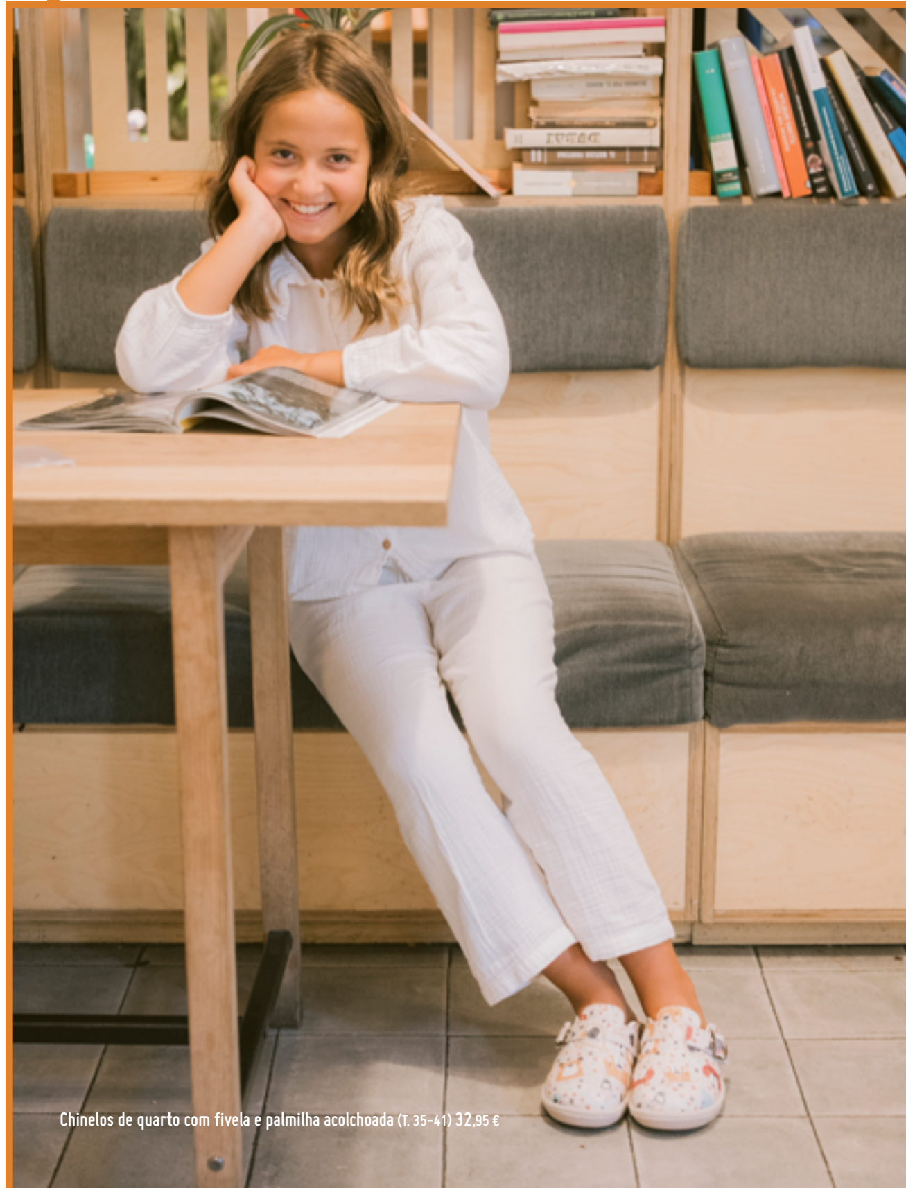
Chinelos de quarto com fivela e palmilha acolchoada (T. 35-41) 32,95 €