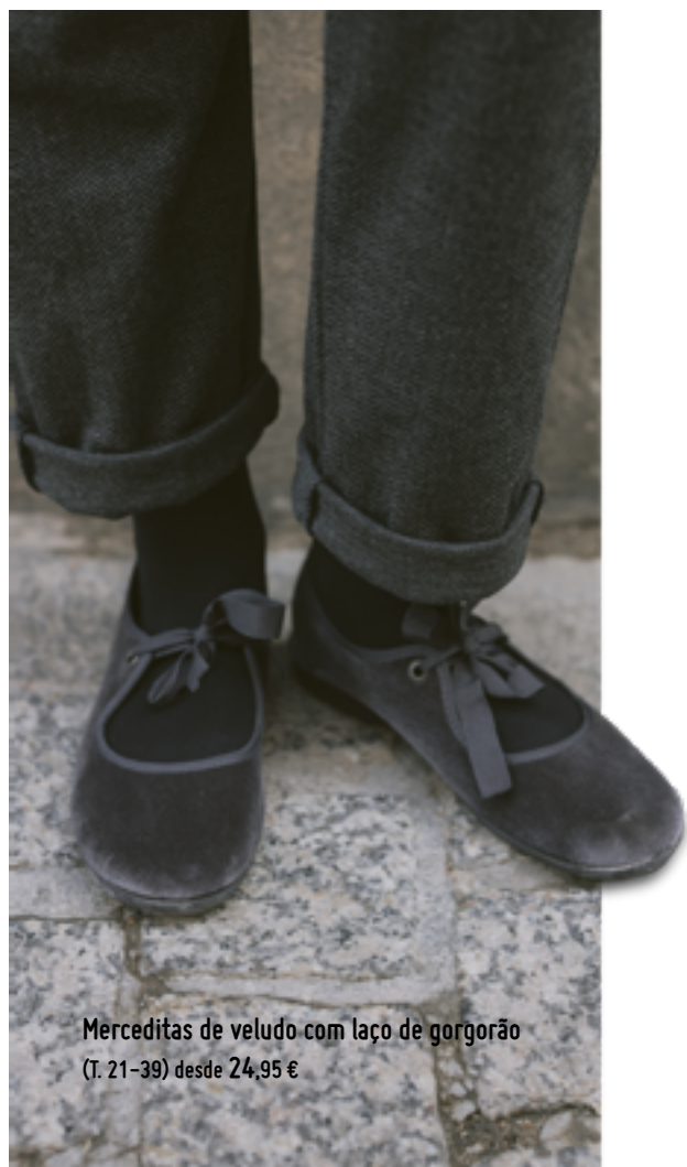
Merceditas de veludo com laço de gorgorão (T. 21-39) desde 24,95 €