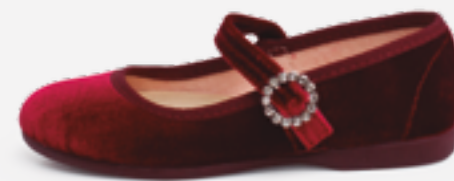
Merceditas de veludo com fivela joia (T. 24-38) desde 31,95 €