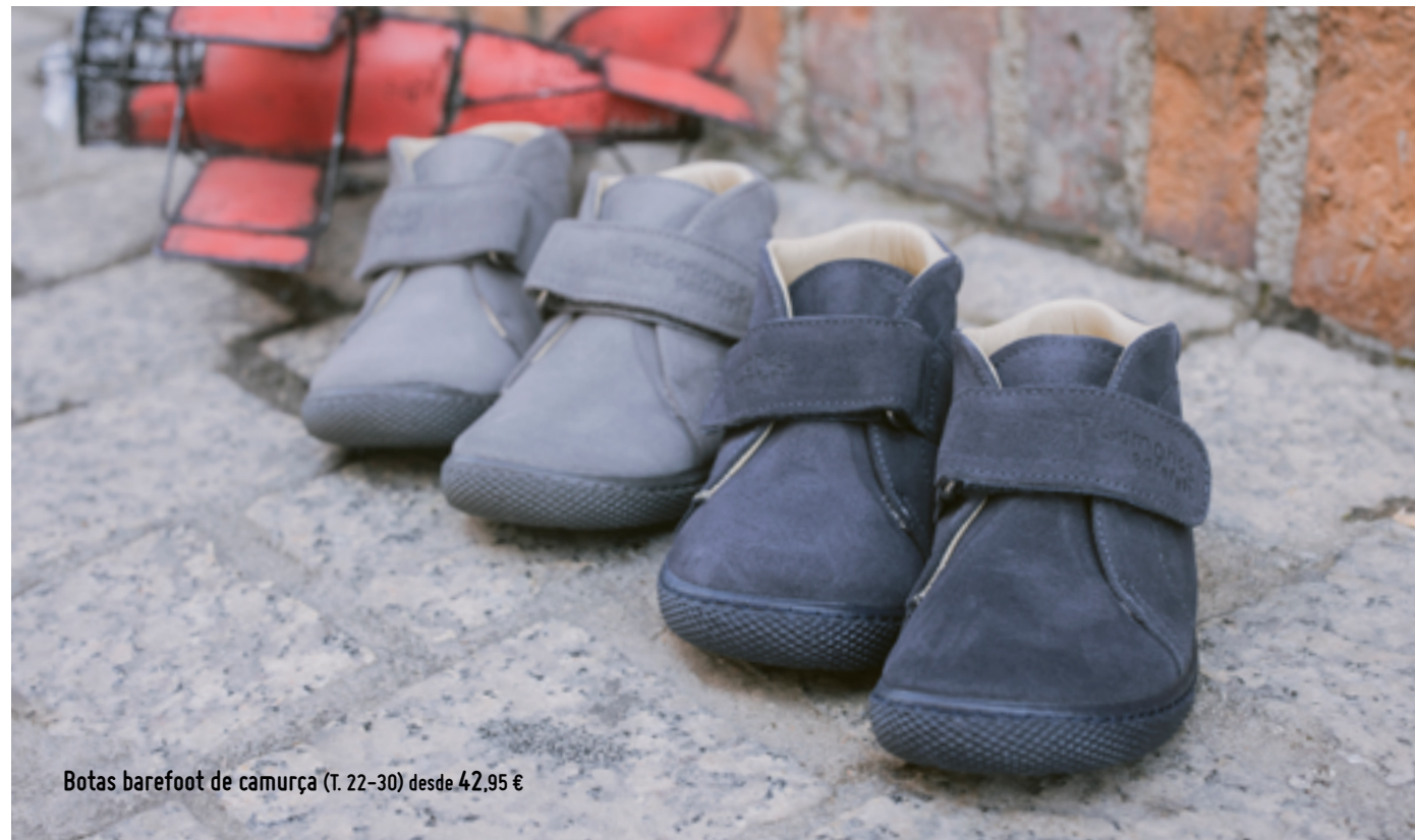
Botas barefoot de camurça (T. 22-30) desde 42,95 €