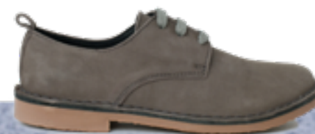
Bluchers de pele nobuck encerada (T. 35-41) 43,95 €