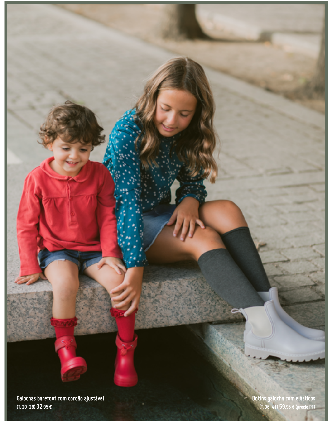
Galochas barefoot com cordão ajustável (T. 20-28) 32,95 €